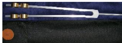
OT 32 Hz (580 zł/$170)