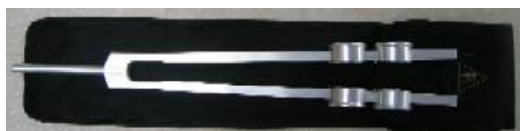
OT 64 Hz (545 zł/$160)